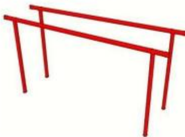
Figura 224 – Barra paralela

Nota: Imagem meramente ilustrativa.